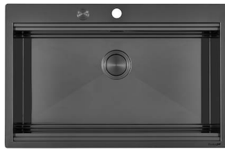
Fregadero Milanello Gun Metal workstation